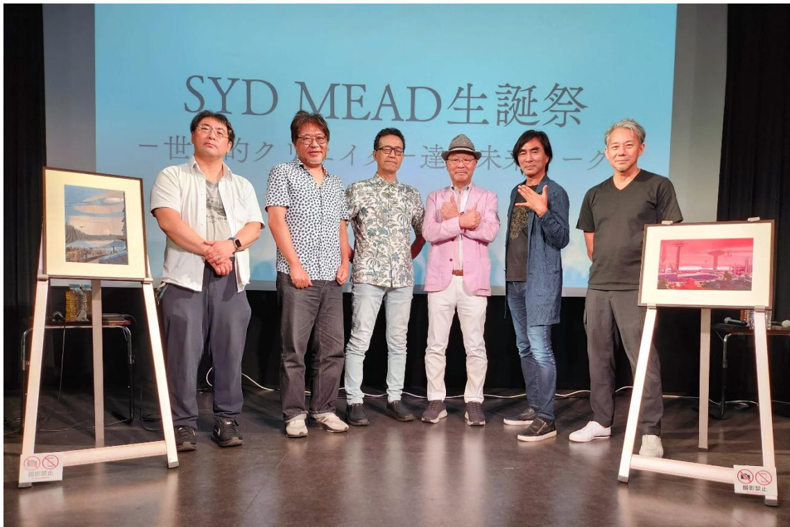
<キャプション> 『SYD MEAD 生誕祭 -世界的クリエイター達の未来トーク-』出演者

また生誕祭を記念して開催した「シド・ミード展ショップ」( https://goods.eplus.jp/sydmead )でのキャンペーンも、第2弾の開催が決定いたしました!「シド・ミード展 PROGRESSIONS TYO 2019」図録〈愛蔵版〉を数量限定で再発売いたします!